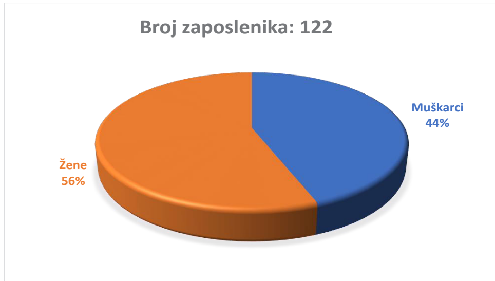
Slika 1. Distribucija zaposlenika prema spolu u Gradu Šibeniku