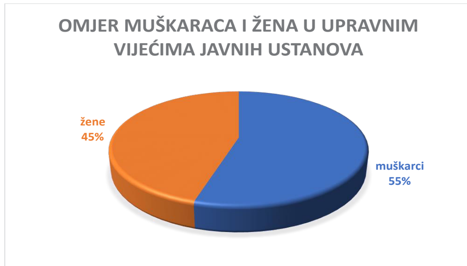
Slika 5. Distribucija prema spolu u Upravnim vijećima Javnih ustanova