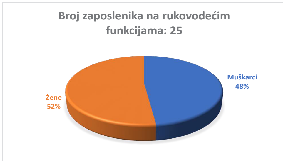
Slika 2. Distribucija zaposlenika na rukovodećim funkcijama prema spolu u Gradu Šibeniku